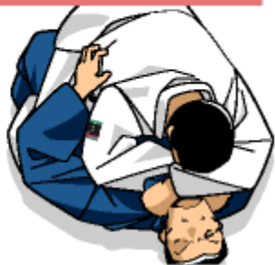
Shime waza (Strangling techniques)