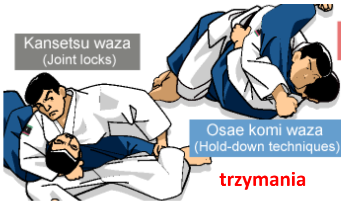
Kansetsu waza (Joint locks)