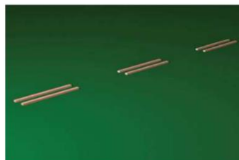
Korytarz z desek