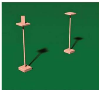
Przedmiot do przewożenia