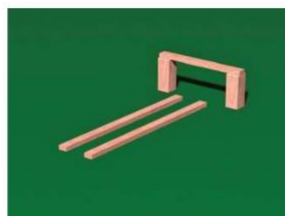
Zatrzymanie w miejscu