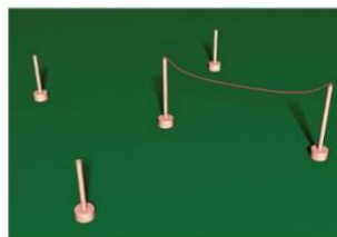
Przewożenie przedmiotu na uwięzi